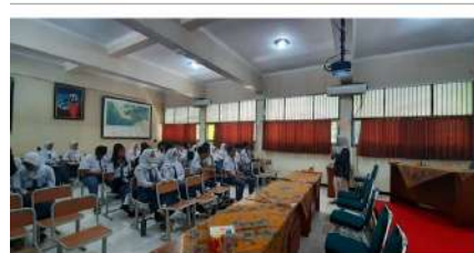
Gambar 3. Paparan Selang Survei Sederhana pada Para Peserta

sederhana yang dilakukan saat kegiatan berlangsung berupa pertanyaan interaktif sederhana kepada para peserta yang berjumlah 40 siswa. Ada lima pertanyaan yang diajukan, yaitu: ‘siapa di sini yang tidak menggunakan handphone?’, ‘siapa di sini yang tidak mengakses internet?’, ‘apa perangkat yang paling sering digunakan untuk mengakses internet?’, ‘adakah di antara kalian yang tidak memiliki akun media sosial?’, ‘media sosial apa yang kalian gunakan?’. Masing-masing jawaban untuk pertanyaan pertama hingga keempat bulat sama dari seluruh peserta, yaitu semua memiliki handphone, semua mengakses internet, paling sering mengakses internet dari handphone/smartphone, dan semua peserta memiliki akun media sosial. Hanya jawaban dari pertanyaan kelima yang bervariasi, dengan rata-rata peserta memiliki akun WhatsApp, Line, dan TikTok, serta sebagian memiliki akun X dan Instagram. Dari data tersebut, baik dari data BPS maupun survei sederhana pada para peserta, tampak bahwa aktivitas bermedia sosial adalah yang tertinggi dalam pemanfaatan internet, yang berarti pula tingginya keterhubungan anak muda secara digital dengan pihak lain yang bisa saja berpotensi pada kekerasan.