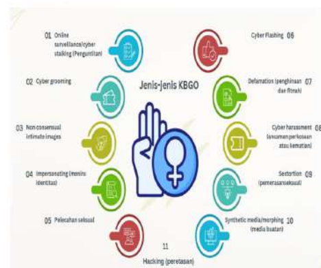
Gambar 4. Bagan Jenis-jenis KBGO

KBGO yang dibahas dalam kegiatan sosialisasi ini yang dirangkum dari Catahu Komnas Perempuan (2023) dan Buku Panduan KBGO SAFEnet (2022). Sebelas jenis KBGO tersebut adalah penguntitan (cyber stalking/online surveillance), cyber grooming, penyebaran non consensual intimate images, pengambilan identitas (impersonating), pelecehan seksual, cyber flashing, penghinaan dan fitnah (defamation), ancaman perkosaan atau pembunuhan (cyber harassment), pemerasan seksual (sextortion), morphing, dan peretasan (hacking). Tiap jenis kekerasan dijelaskan tidak hanya definisinya, tapi juga contoh kasusnya.