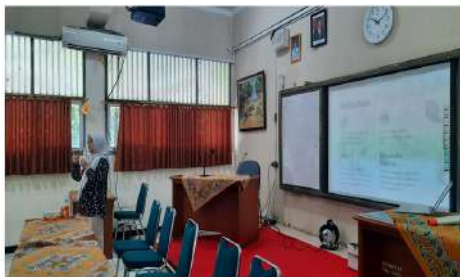
Gambar 2. Pemaparan data penggunaan internet

Kegiatan edukasi Kekerasan Berbasis Gender Online (KBGO) di SMA 66 Jakarta dilaksanakan dalam satu sesi interaktif yang melibatkan siswa sebagai peserta utama. Sosialisasi ini diawali dengan pemaparan data-data penggunaan internet yang memfokuskan pada data pengguna kelompok usia muda dan di wilayah perkotaan. Membuka paparan dengan data dilakukan untuk membuka mata peserta pada realitas, khususnya untuk menunjukkan bahwa peserta sebagai remaja adalah bagian dari kelompok usia muda yang menyumbang angka pengguna internet terbesar, baik di Indonesia maupun secara global.